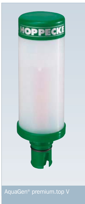
AquaGen® premium.top V

Der AquaGen® premium.top-Rekombinator wird als externes Bauteil auf der Batterie installiert. Dadurch wird ein Temperaturanstieg in der Batterie ausgeschlossen. Die Trennung der Rekombination von den aktiven Bauteilen der Batterie ermöglicht die Reduzierung des Wartungsaufwandes analog zu verschlossenen Batterien, ohne Reduzierung der Gebrauchsdauererwartung und ohne Einschränkung der Betriebsbedingungen.