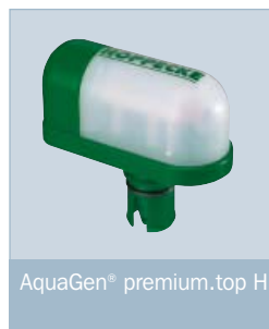
AquaGen® premium.top H

Für Kapazitäten bis 340 Ah sowie für Anwendungen mit abmessungsbedingten Einschränkungen (wie Höhe in Bezug auf die Batterieaufstellung sowie Tiefe in Bezug auf das Zellenmaß) ist die Ausführung AquaGen® premium.top H verfügbar.