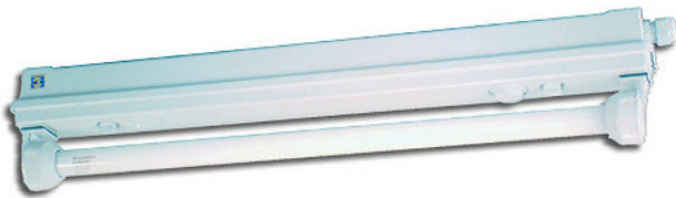
Abbildung Typ RTF